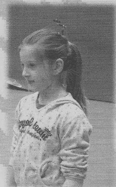
Ztudly – Ororo Vansevenant